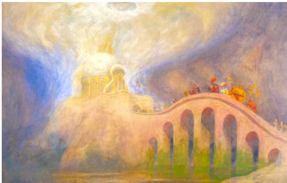
ヘルマン・リンデ作「橋の上の神殿」